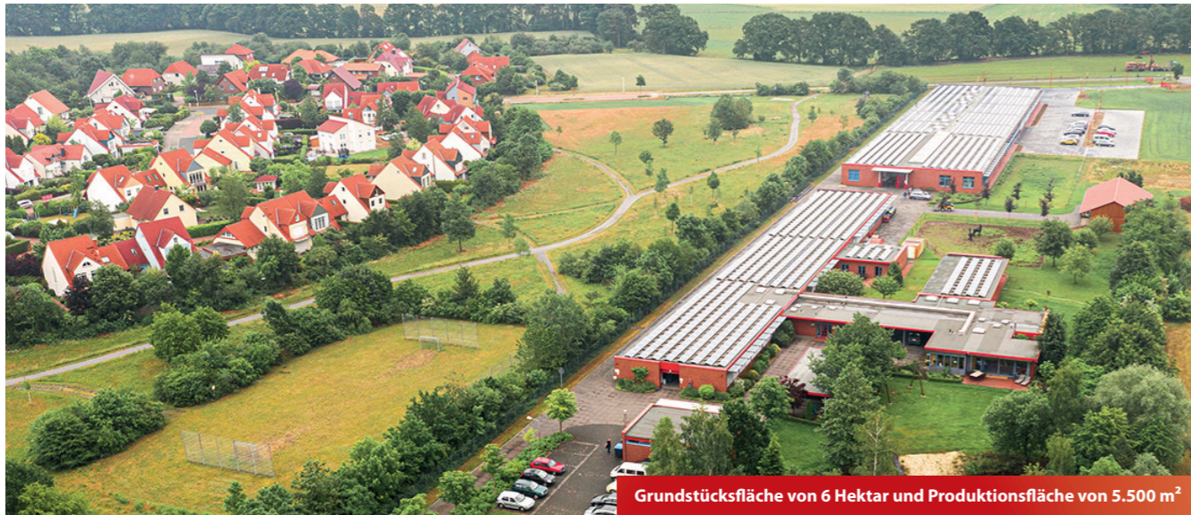
Grundstücksfläche von 6 Hektar und Produktionsfläche von 5.500 m 2

Als Entwickler und Hersteller hochpräziser Diamant-Abrichtwerkzeuge bieten wir, die ROT GmbH, innovative und maßgeschneiderte Lösungen für unsere Kunden.