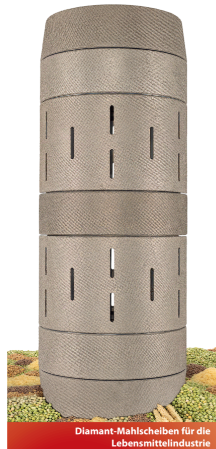
Diamant-Mahlscheiben für die Lebensmittelindustrie