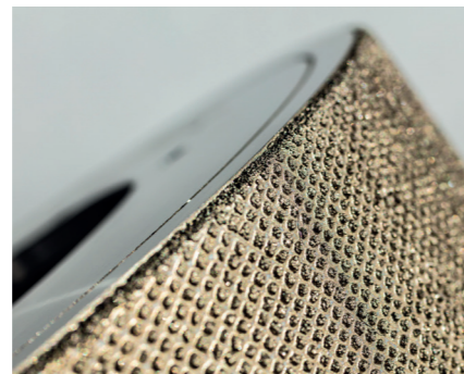
Mehrschichtiger Diamantbelag in Gruppen angeordnet