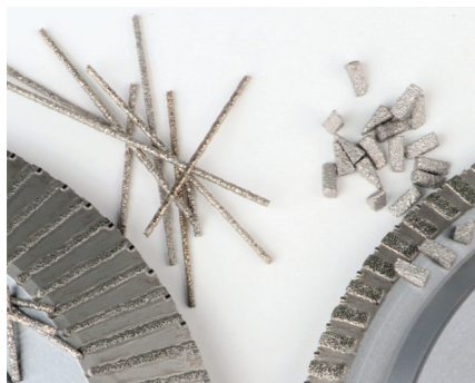
Diamant-Segmentfertigung für unsere Werkzeuge

Unsere Verfahrenstechnik „Vakuumlöten“ ermöglicht viele neue Möglichkeiten.